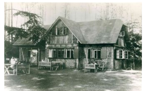
Hus Uhlenflucht um 1930

Für die Initiative „Volkshaus Rostock“ Klaus Röber